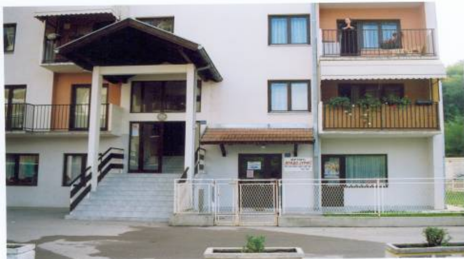
Вртић "Владо Јурић", изграђен 1998/99. ради од 2000.г.