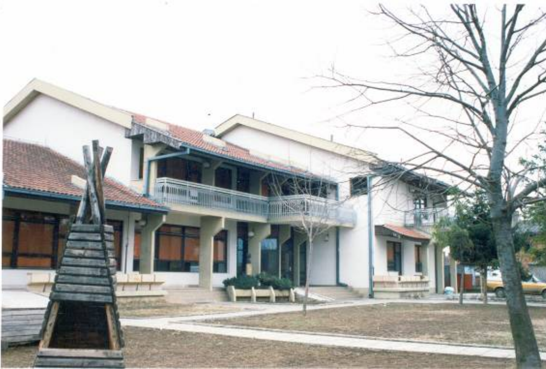
Вртић "Звончић" реконструисан 1998.г.(изграђен као "Живка Мићић" 1964