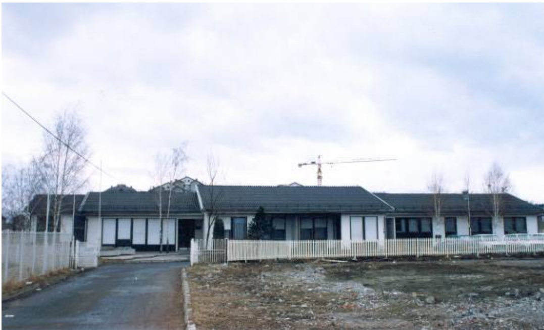
Вртић "Лептрић", изграђен 1981. (радио од 1976. у згради Дечје заштите, у Обилићској)

* Тим и тимски рад и Вртић као Отворени систем, 1996. у организацији ПДС; учесници педагог и психолог а 1997. исти семинар педагог је је реализовао на нивоу установе и региона;