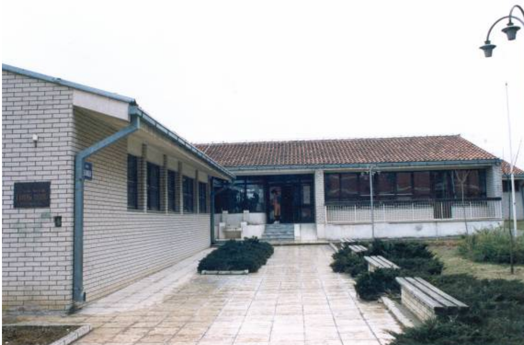
Вртић "Голуб мира" .изграђен 1985.г.