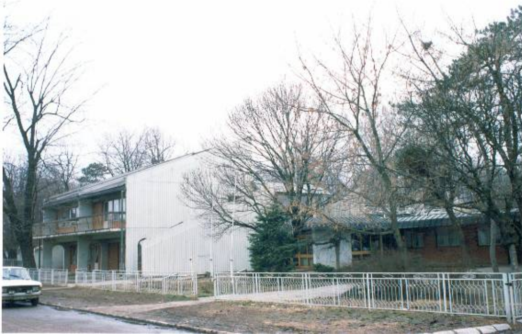
Вртић "Невен" и управна зграда Установе, изграђен 1978; дограђиван 1988.; реконструисан 2002.

- оптимална финансијска подршка оснивача, сопствени приходи и донације