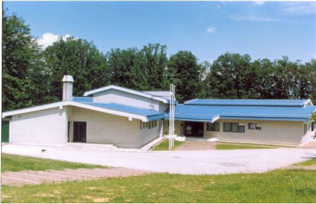
Вртић "Јеленко" у Рибарској Бањи, изграђен 1989. г.

ОДМОР И РЕКРЕАЦИЈА ДЕЦЕ - као додатни, повремени, програм организује се у Рибарској Бањи и Сутомору, као здравствено рекреативни.