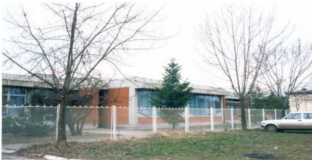
Вртић "Бисери" , изграђен 1978.г.