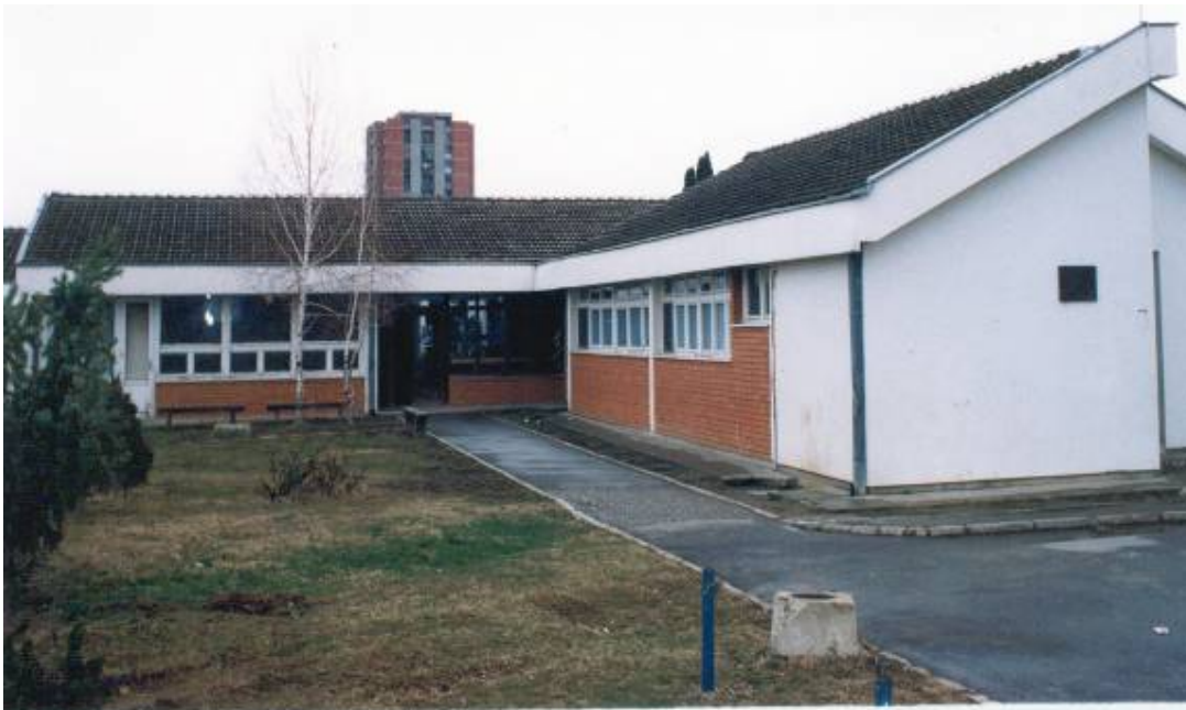
Вртић "Наша радост",изграђен 1978.г.

- максимално могуће уважавање потреба родитеља за смештајем деце у вртићу у целодневном боравку до 3 и од 3 до 5,5 година.