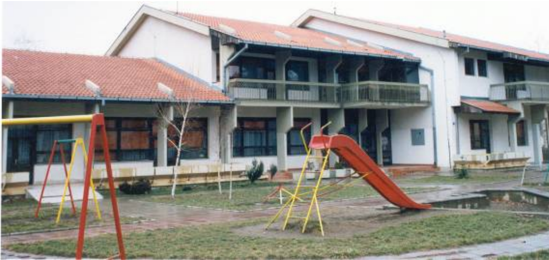
Вртић "Колibri" реконструисан 1998.(изграђен 1965. као "Радојка Зајић)