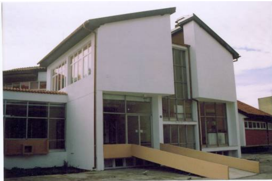
Вртић "Пчелица", 2005.(реконструисан вртић "Партизанка Дана" изграђен 1974.)