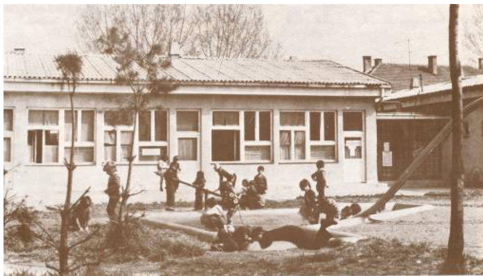
Вртић "Живка Мићић" изграђен 1964.г.