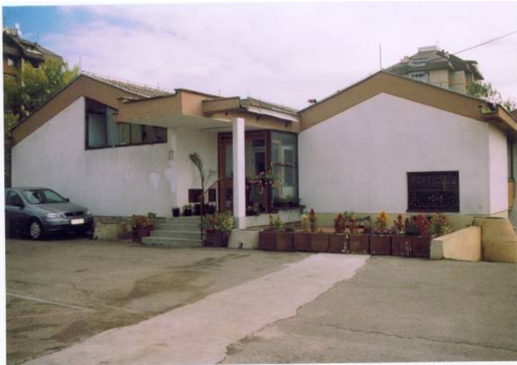
Кухиња "Пионир", изграђена 1980.г.