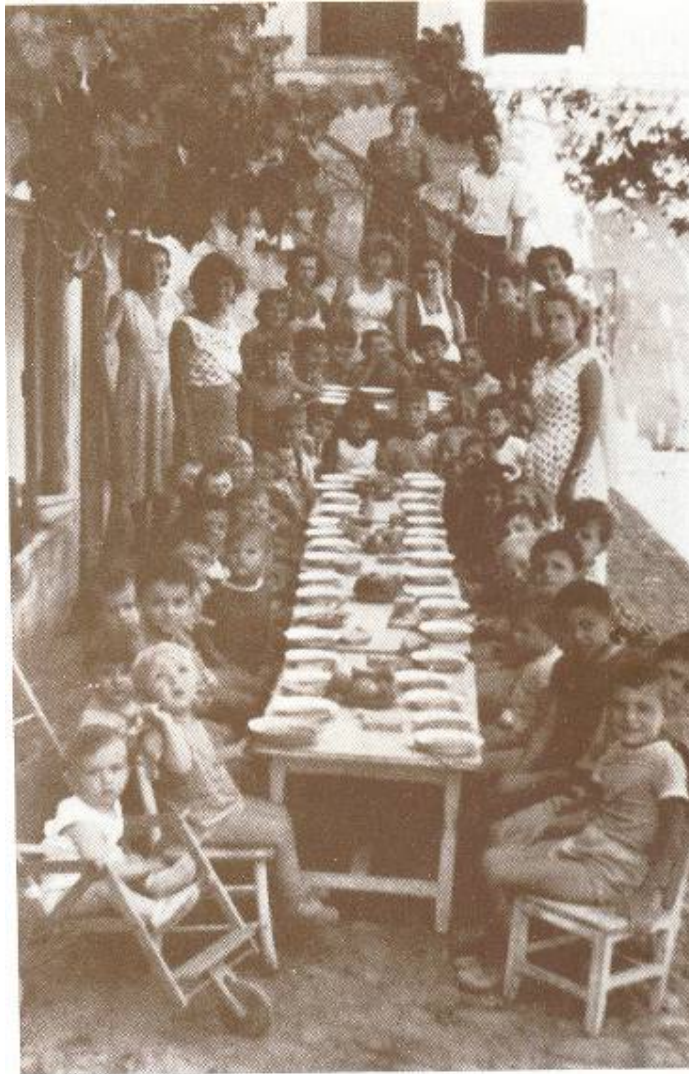
Обданишта "Закић" -1946/47.

Одмах после рата, 1945. у граду се , на иницијативу АФЖ-а, чије чланице у њему и раде, оснива прво Обданиште за децу од 4 до 7 година , а већ наредне 1946. и прве јаслице, за децу од 2 месеца до 3 године , у Улици Милоја Закића 10 - 12, по којој и носи назив, Дечје обданиште "Закић" , отворено 2. априла