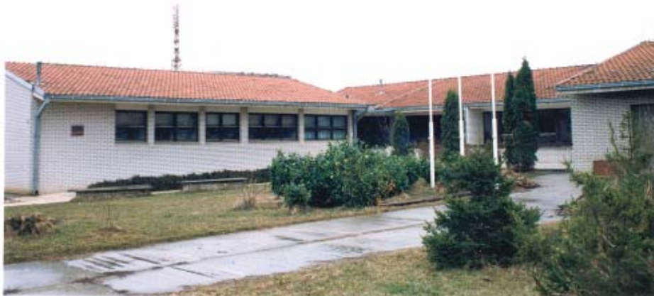
Вртић "Лабуд", изграђен 1986.г.

За успешан рад наша установа, појединци и деца, добитници су бројних награда,признања и похвала, на локалном и републичком нивоу.