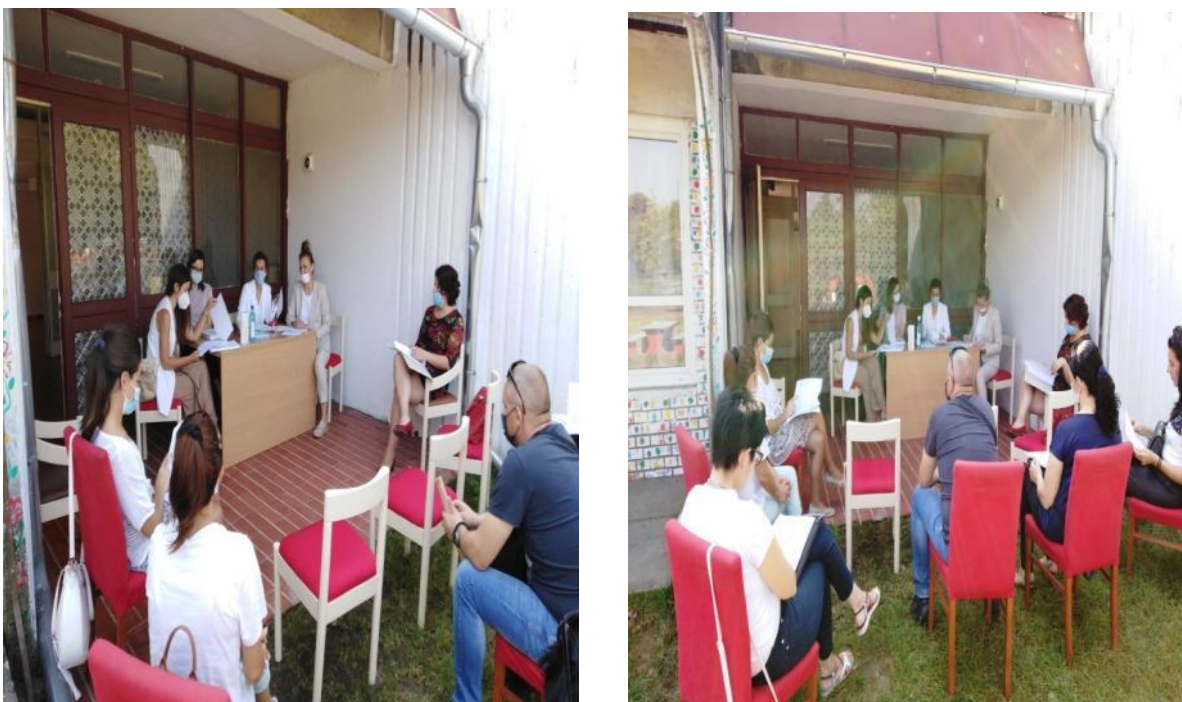
На заједничком задатку, ка циљу остваривања добробити за децу