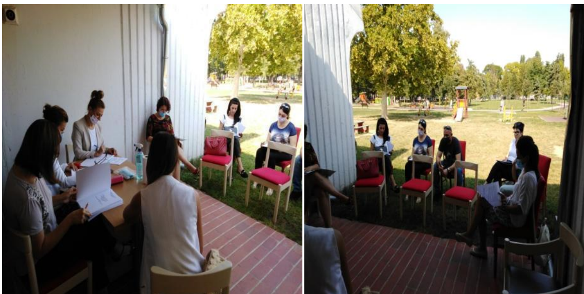
Радна атмосфера, правна, психолошко-педагошка служба и родители