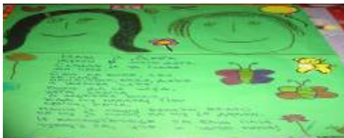
Родитељи пишу стихове о деци