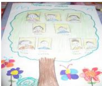
Сви су поносни на породично стабло