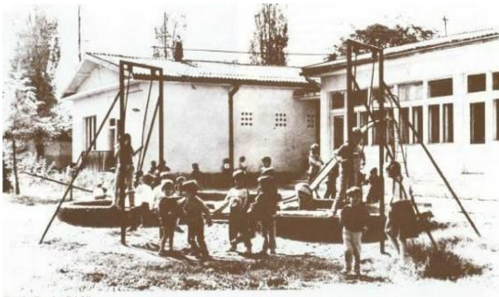
Вртић "Радојка Зајић" из 1965.г.