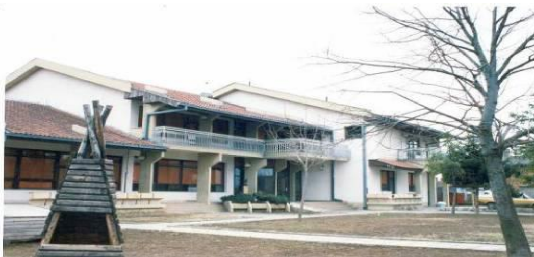
Вртић "Звончић" реконструисан 1998.г.(изграђен као "Живка Мићић" 1964