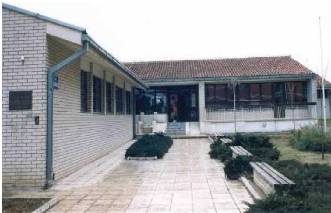
Вртић "Голуб мира",изграђен 1985.г.