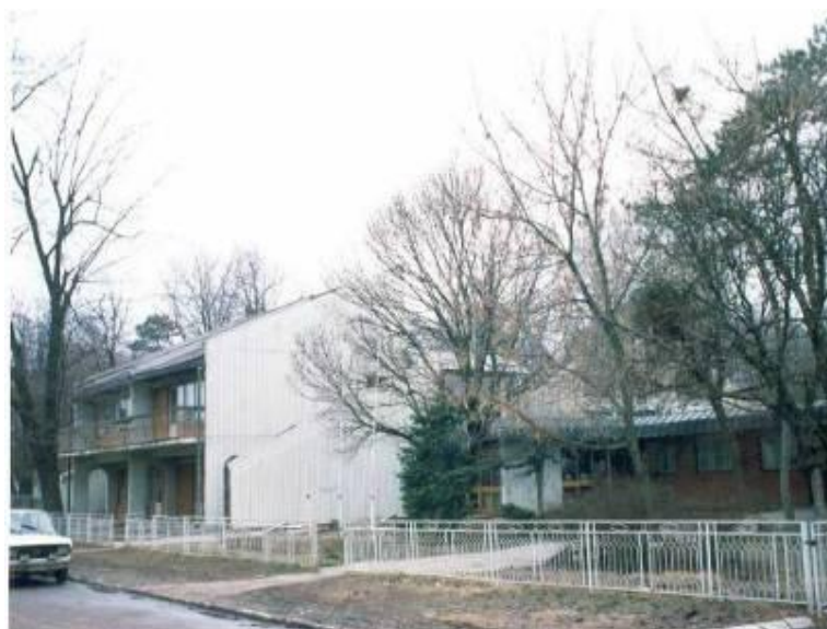
Вртић "Невен" и управна зграда Установе, изграђен 1978;дограђиван 1988.: реконструисан