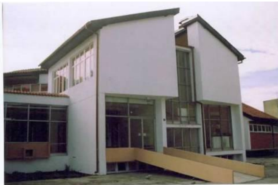
Вртић "Пчелица", 2005. (реконструисан вртић "Партизанка Дана" изграђен 1974.)