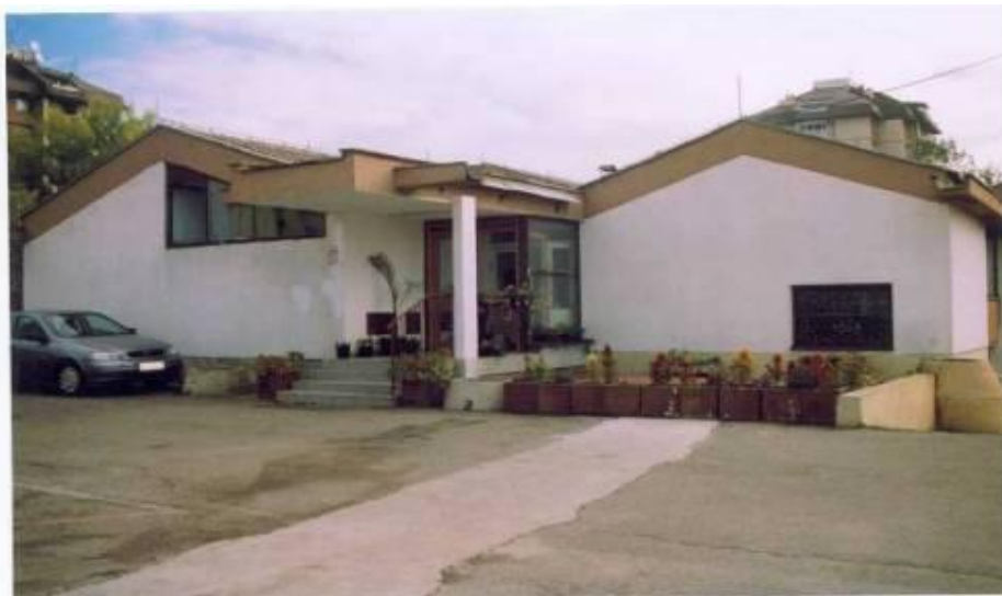
Кухиња "Пионир", изграђена 1980.г.