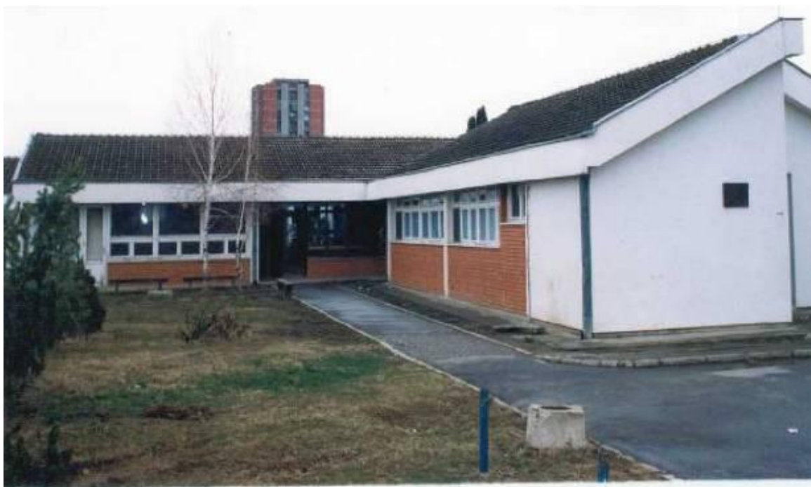
Вртић "Наша радост",изграђен 1978.г.