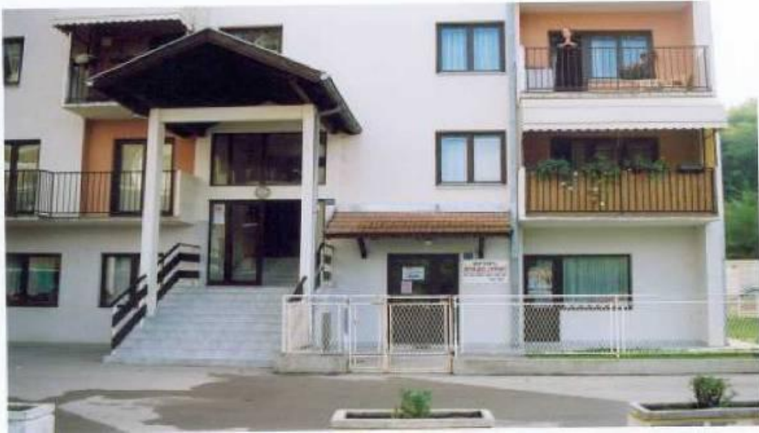
Вртић "Владо Јурић" ,изграђен 1998/99. ради од 2000.г.