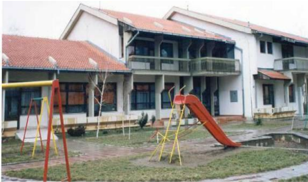
Вртић "Колибри"реконструисан 1998.(изграђен 1965. као "Радојка Зајић)