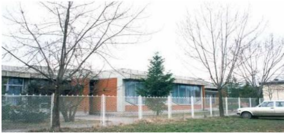
Вртић "Бисери" , изграђен 1978.г.