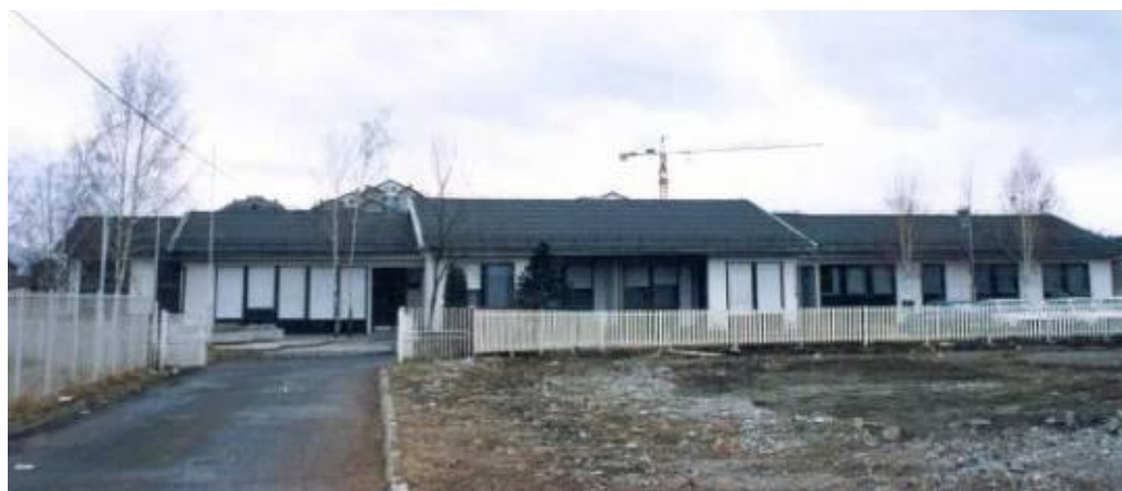
Вртић "Лептирић",изграђен 1981. (радио од 1976. у згради Дечје заштите,уОбилићевој)