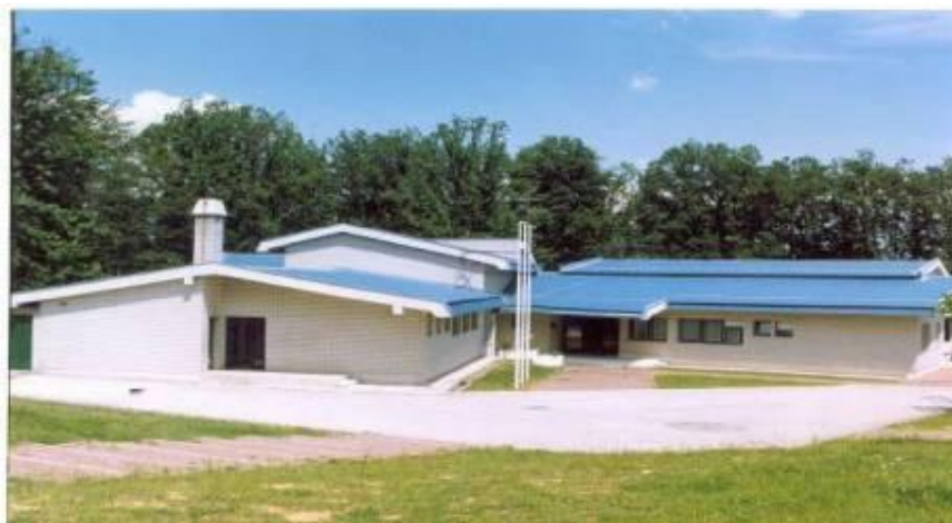
Вртић "Јеленко" у Рибарској Бањи, изграђен 1989. г.

ОДМОР И РЕКРЕАЦИЈА ДЕЦЕ - као додатни, повремени, програм организује се у Рибарској Бањи, а објекат у Сутомору није у функцији.