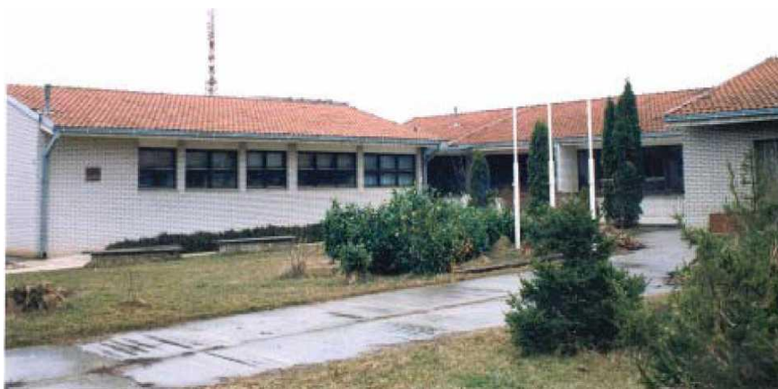
Вртић "Лабуд" изграђен 1986.г.