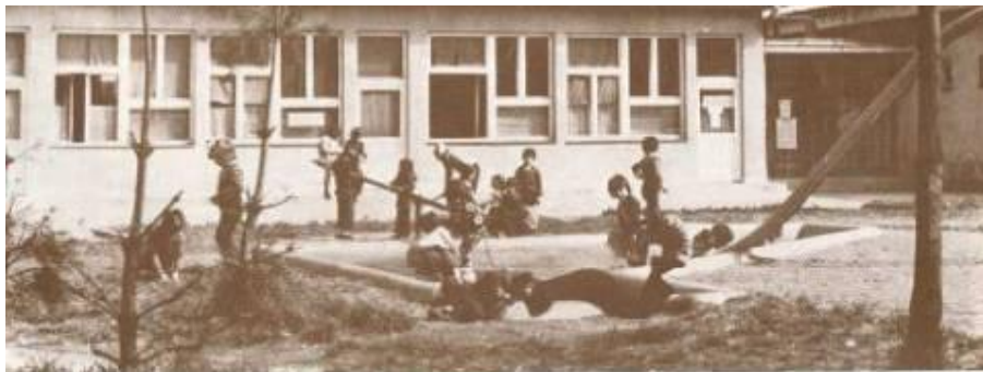
Вртић "Живка Мићић" изграђен 1964.г.